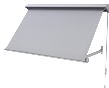
DA22 här illustrerad med tillvalet designfront utan kapp. Grundutförandet är standardfront med kapp.

Till DA22 finns det ett stort utbud av både markisväv och screenväv. Berøende på vävvalet kan markisen blockera upp till 90% av den instrålande värmen vilket kan hjälpa till att sänka energikostnader radikalt.